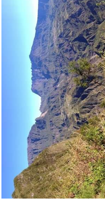
par /lilasBZ4 | Publié 22 Mars 2024