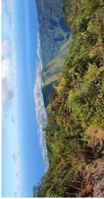
par UlasZ4 | Publié le février 2024